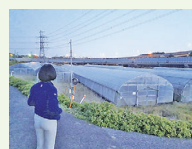
撤退で放置されたハウス

花見川区犢橋地区で国の補助金を活用し、ベビーリーフを生産していた企業が、度重なる浸水被害等で事業撤退。補助金が事業者から国へ返還されることになりました。